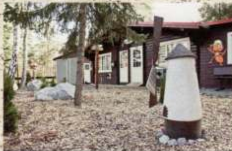
Außenanlage und Haus 1