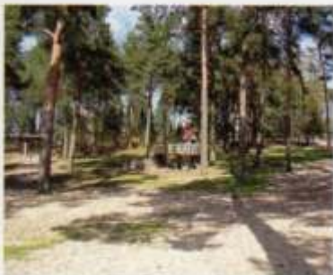
Abenteuerspielplatz mit Adventure-Golfanlage

Um eventuelle psychologische Notsituationen aufzufangen, stellen wir eine psycho-onkologische Erstbetreuung und eine kinderpsychologische Betreuung zur Verfügung. Allgemein- und Zahnärzte sowie Apotheken sind ebenfalls in den benachbarten Orten zu finden, eine schnelle Klinikanbindung besteht zu den Kinderkliniken mit onkologischen Kinderstationen in Wolfsburg (21 km), Braunschweig (40 km) und Hannover (72 km).