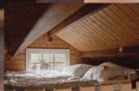
Schlafplatz im Dachboden